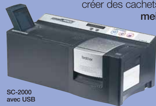
SC-2000 avec USB

Que vous soyez un fabricant de cachets réputé, un copy shop, un service express ou un revendeur de fournitures de bureau, ou que vous soyez en train de lancer votre propre entreprise, nous avons l'appareil qui fera forte impression. Le Brother Stampcreator PRO™ permet de créer des cachets pré-encreés rapidement, ce qui en fait l'appareil offrant la meilleure marge du marché.